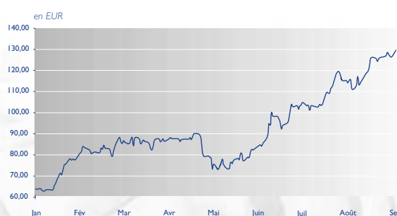
Evolution du cours de l'action CMB 2004

Les institutions financières auprès desquelles les actionnaires peuvent exercer leurs droits financiers sont Fortis Banque, Petercam et Dexia.